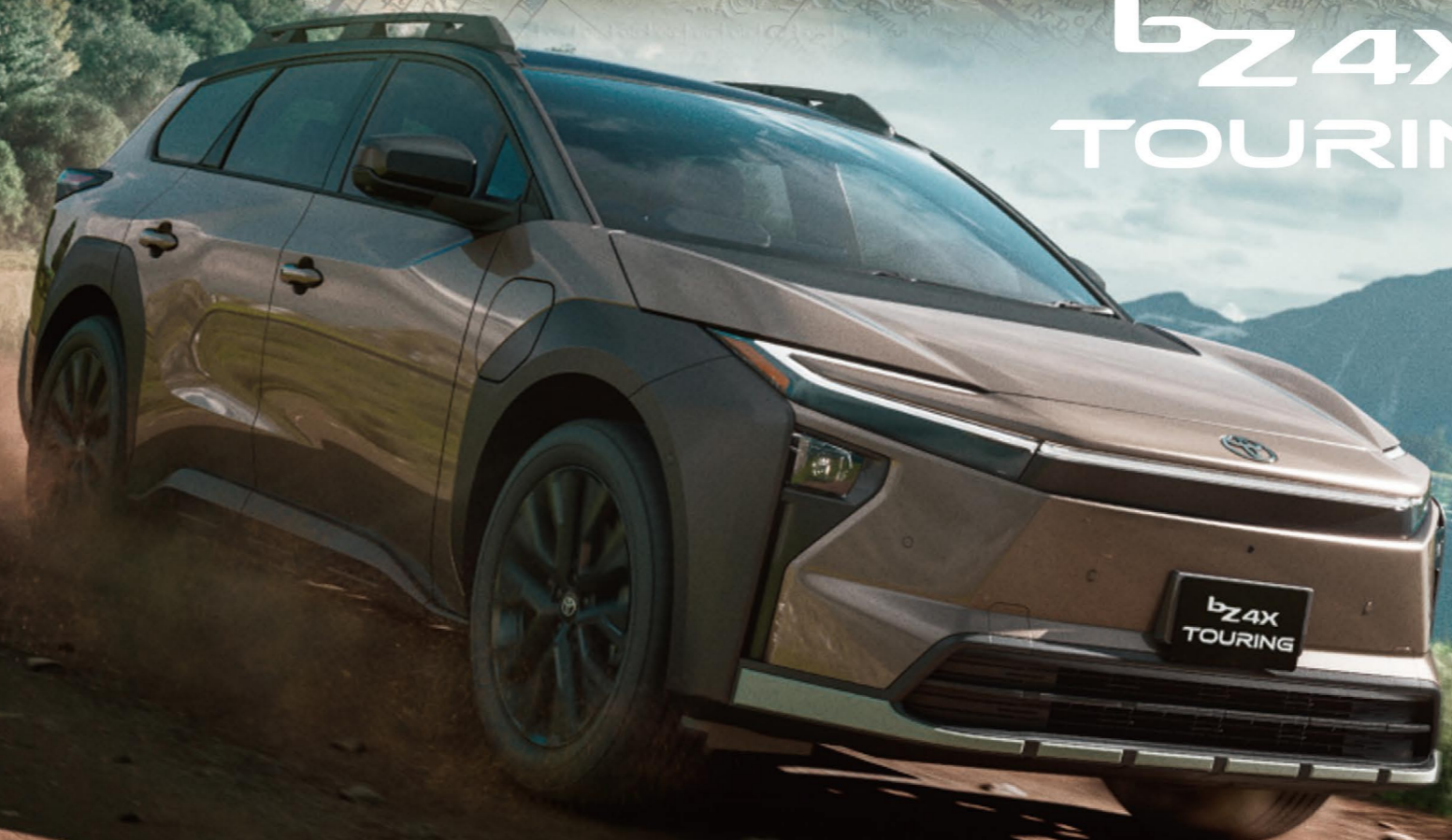
Photo:Z.ボディカラーのクリスタルブラックシリカ×ブリリアントブロンズメタリック[D36]はメーカーオプション55,000円となり、車両本体価格に含まれておりません。